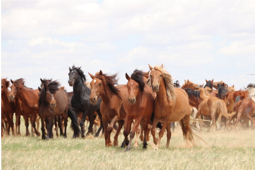
Cavalls actuals a les estepes de Mongòlia

"Els jaciments catalans han aportat el 60% de la mostra genètica de cavalls peninsulars d'aquest estudi", destaca Nieto Espinet. Totes les restes arqueozoològiques han estat prèviament estudiades al laboratori d'Arqueologia de la UdL, abans de l'anàlisi genètica a França. Actualment, un dels fetus d'èquid de la fortalesa dels Vilars analitzats està exposat al Museu d'Arqueologia de Catalunya (Barcelona).