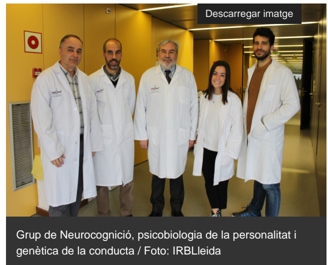
Grup de Neurocognició, psicobiologia de la personalitat i genètica de la conducta

El lòbul frontal del cervell, relacionat amb el control de la conducta, és capaç de diferenciar diverses fases de la memòria de treball ( Working Memory ), codificació, retenció i recuperació, segons la complexitat del record. Així ho revela una recerca del grup Neurocognició, psicobiologia de la personalitat i genètica de la conducta [