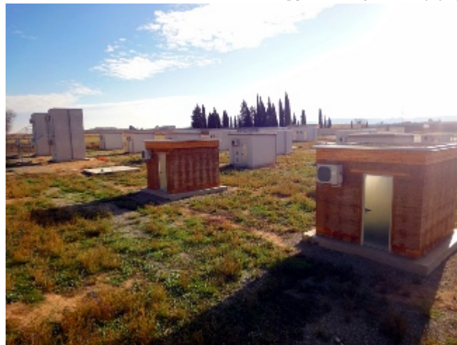
/export/sites/universitat-lleida/ca/serveis/c Estació experimental del GRE a Puigverd de Lleida

La Universitat de Lleida (UdL) acollirà la propera setmana l' Innostock 2012 [ http://www.innostock2012.org/ ], un dels anomenats congressos Stock promoguts per l'Energy Conservation through Energy Storage Implementing Agreement [ http://www.iea-eces.org/ ] (ECES IA) de l' Agència Internacional de l'Energia [ http://www.iea.org/ ] (IEA) que se celebra cada tres anys en una ciutat del món diferent. Les darreres edicions han tingut lloc a Varsòvia, Nova Jersey i Estocolm. Aquest és el primer cop que una ciutat de l'Estat espanyol acull un dels congressos Stock, ja que des del seu inici, al 1981, només s'han celebrat a França, Suècia, Finlàndia, Alemanya, Holanda i Polònia.