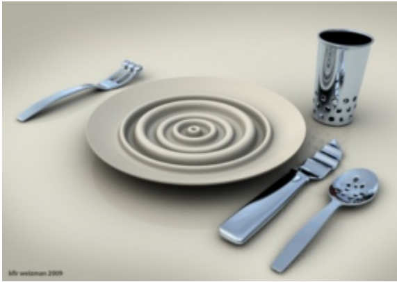
s/oficina/.galleries/images/imatge Segon Premi: Kfir Weizman