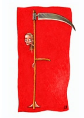
'oficina/.galleries/images/imatges Accèssit: Eric Van der Wal