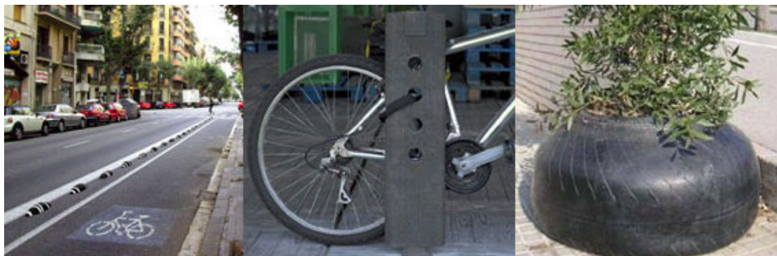
Algunes de les imatges de l'exposició: Disseny per al Reciclatge: Producte Reciclat/Reciclable