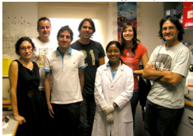
/export/sites/universitat-lleida/ca/serveis/ Grup de Neurobiologia Molecular

Un estudi dut a terme per un grup internacional d'investigadors i coordinat per membres de l' Institut de Recerca Biomèdica de Lleida (IRBLleida) [ http://www.irblleida.org ] de la UdL i de l' Institut Max-Planck de Neurobiologia de Munich (MPIN) [ http://www.neuro.mpg.de/english/index2.html ] demostra que les proteïnes de superfície cel·lular FLRT contribueixen a la regulació dels mecanismes de formació de l'escorça cerebral. Els resultats de la investigació han permès descobrir que una de les funcions d'aquestes proteïnes és la de coordinar la migració de les neurones cap aquesta àrea del cervell, on es desenvolupa la nostra intel·ligència, llenguatge i habilitats cognitives. Concretament impedeixen que les neurones més joves hi arribin, abans d'hora, actuant com a "senyals repulsives".