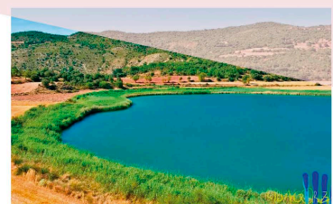
DESERT BADAIN JARAN