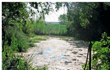
LLAC DE BANYOLES