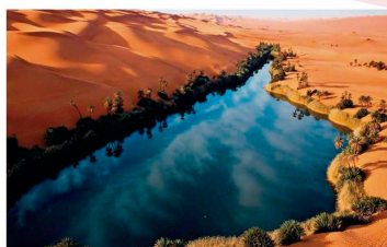
LAS TABLAS DE DAIMIEL