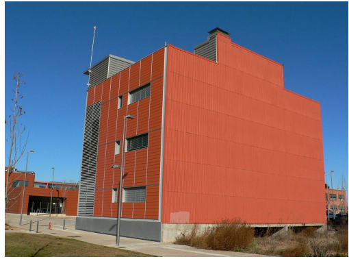
Edifici de l'UdL-IRTA, cofinançat amb Fons FEDER.