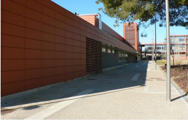
Edifici de Serveis Científico-Tècnics a l'ETSEA, cofinançat per la Generalitat Catalana (Pla Plurianual d'Inversions Universitàries PPIU) i els Fons FEDER.