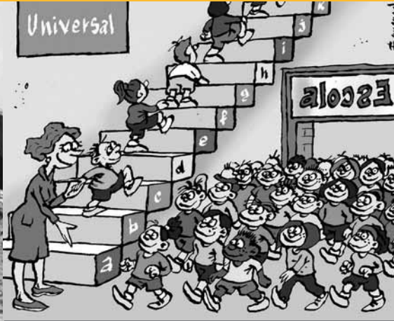
Objectius del Mil·leni

A través d'il·lustracions s'expliquen els 8 objectius del mil·leni: eradicar la pobresa extrema i la fam; millorar la salut materna; assolir l'ensenyament primari universal; combatre la sida, el paludisme i altres malalties; promoure la igualtat entre els sexes; garantir la sostenibilitat del medi ambient, reduir la mortalitat infantil; i fomentar una associació mundial per al desenvolupament. Proposta de la Coordinadora d'ONGD i altres Moviments Solidaris de Lleida.