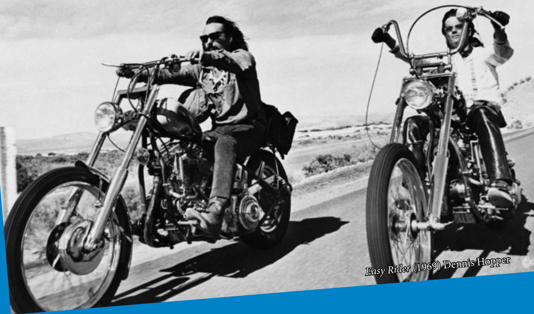
Easy Rider (1969) Dennis Hopper

Lleida / Balaguer, Esterri d'Àneu, la Seu d'Urgell, Tàrrrega