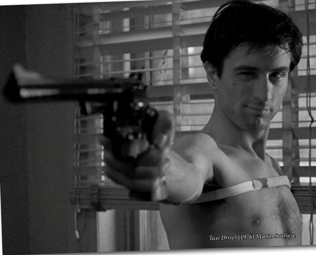
Taxi Driver (1976) Martin Scorsese