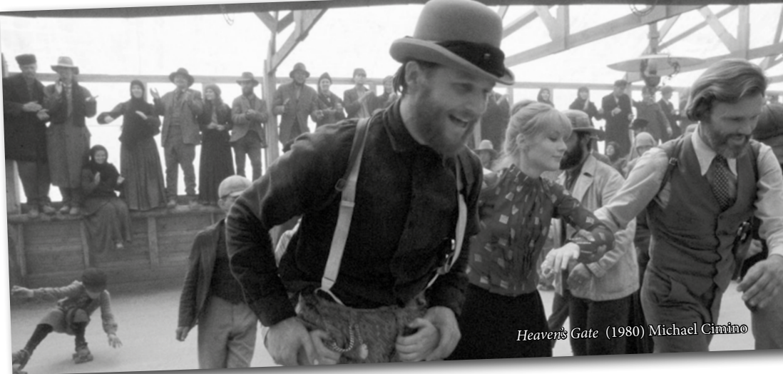
Heaven's Gate (1980) Michael Cimino

zaven menys pel·lícules, i aquestes eren més cares i no resultaven gaire atractives entre el públic jove, que suposava el 70% dels assistents a les sales de cinema. L'arribada de la nova generació de cineastes va suposar la salvació dels vells estudis, que estaven en ple procés d'absorció, per part de conglomerats empresarials. A aquestes pel·lícules les van seguir l'èxit d' Easy Rider ( Buscado mi destino , 1969), de Dennis Hooper, i Midnight Cowboy ( Cowboy de medianoche , 1969), de John Schlesinger, que suposen el veritable punt de partida del moviment. Les diferents produccions que es van anar realitzant van obtenir l'acceptació de públic i crítica, fins que van arribar els fracassos de Heaven's Gate ( La puerta del cielo , 1980), de Michael Cimino, i One from Heart ( Corazonada , 1982), de Coppola, que van significar la ruïna de les seves productores i la fi d'una època.