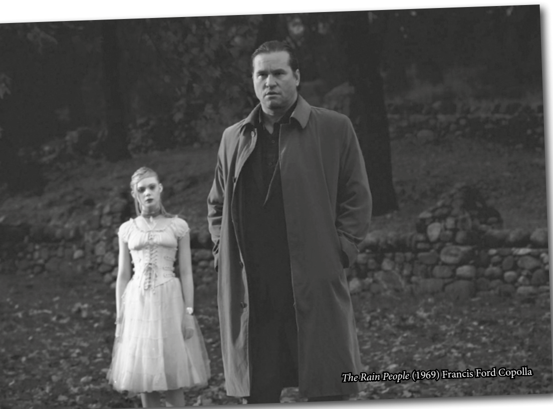
The Rain People (1969) Francis Ford Coppola

Una dona embarassada fuig de la seva parella i pel camí coneix un jove que pateix un cert grau de retard mental.