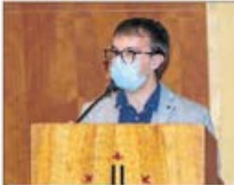
ORIOAL ALÀS CERCÓS

MILLORS TREBALLS FINAL DE GRAU D'ESTUDIANTS QUE CONTINUEN EL MÀSTER A LA UDL