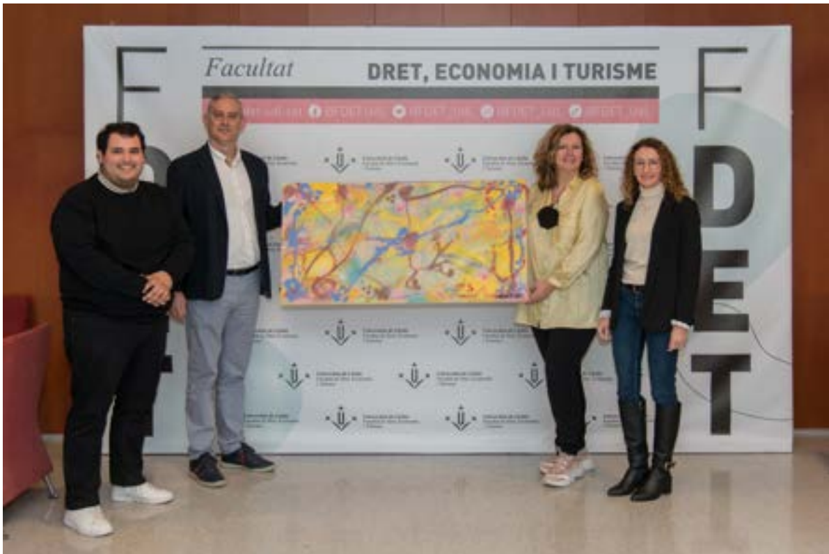
Lliurament del quadre d'AKA Modesto al degà de la FDET de la UdL. Foto 23