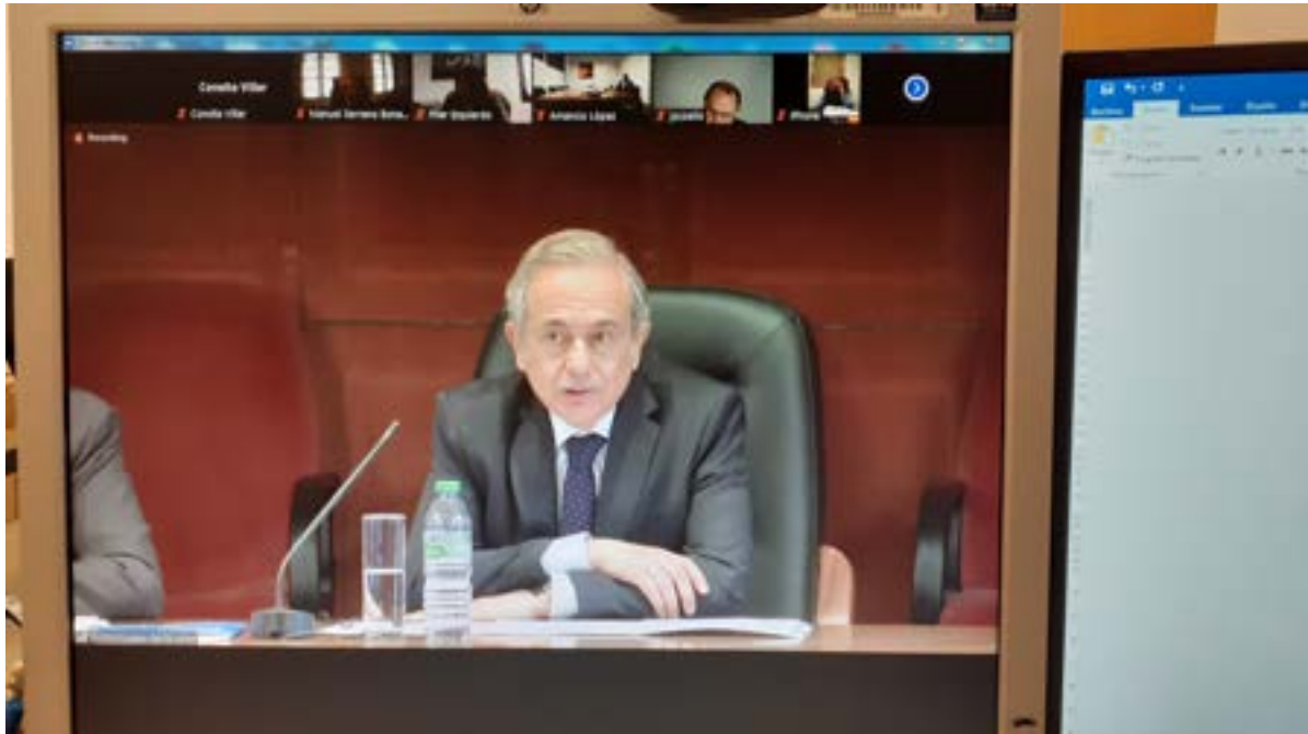
Asamblea de la Conferencia de consejos sociales Foto 14.