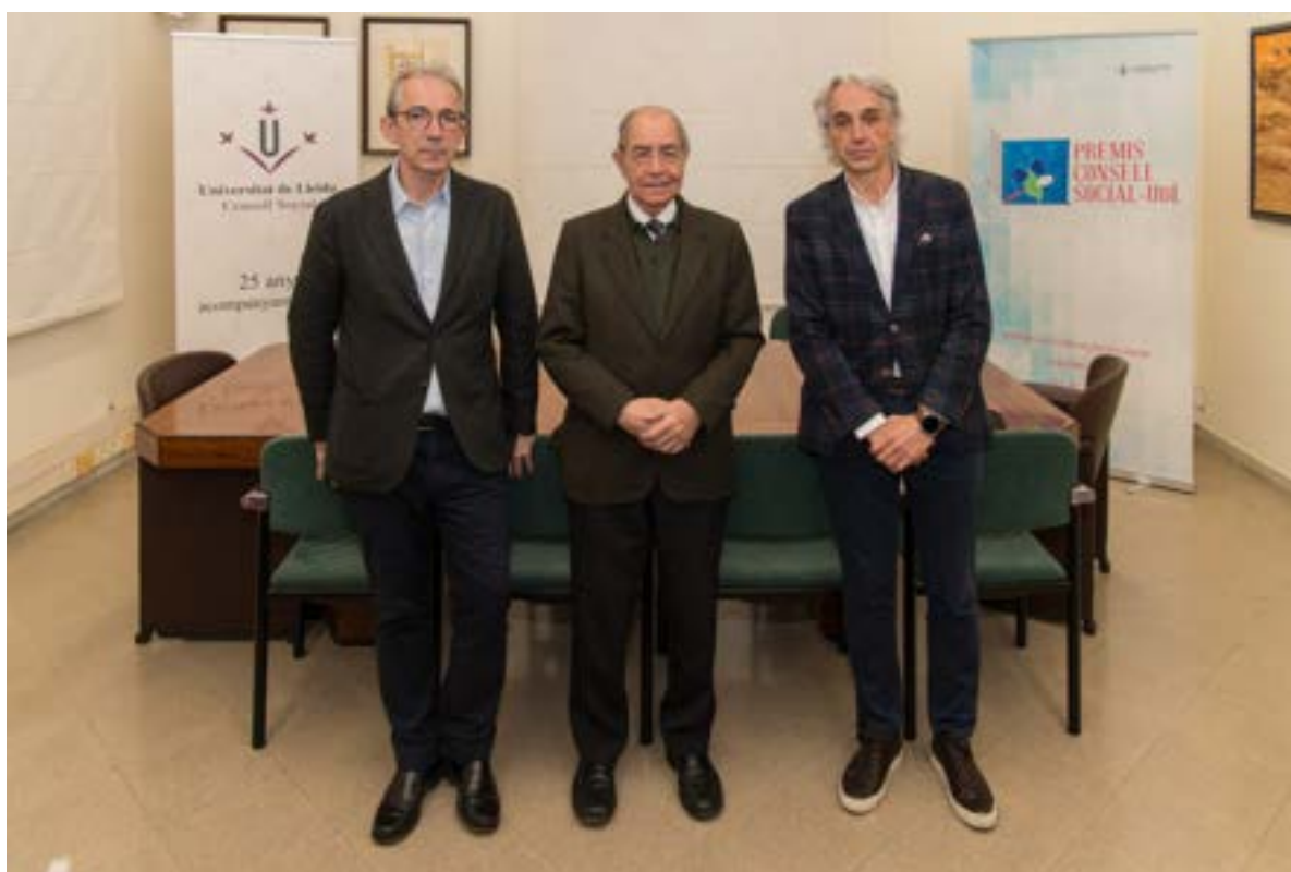
Els tres presidents del Consell Social preparant la gravació del Podcast Foto 28