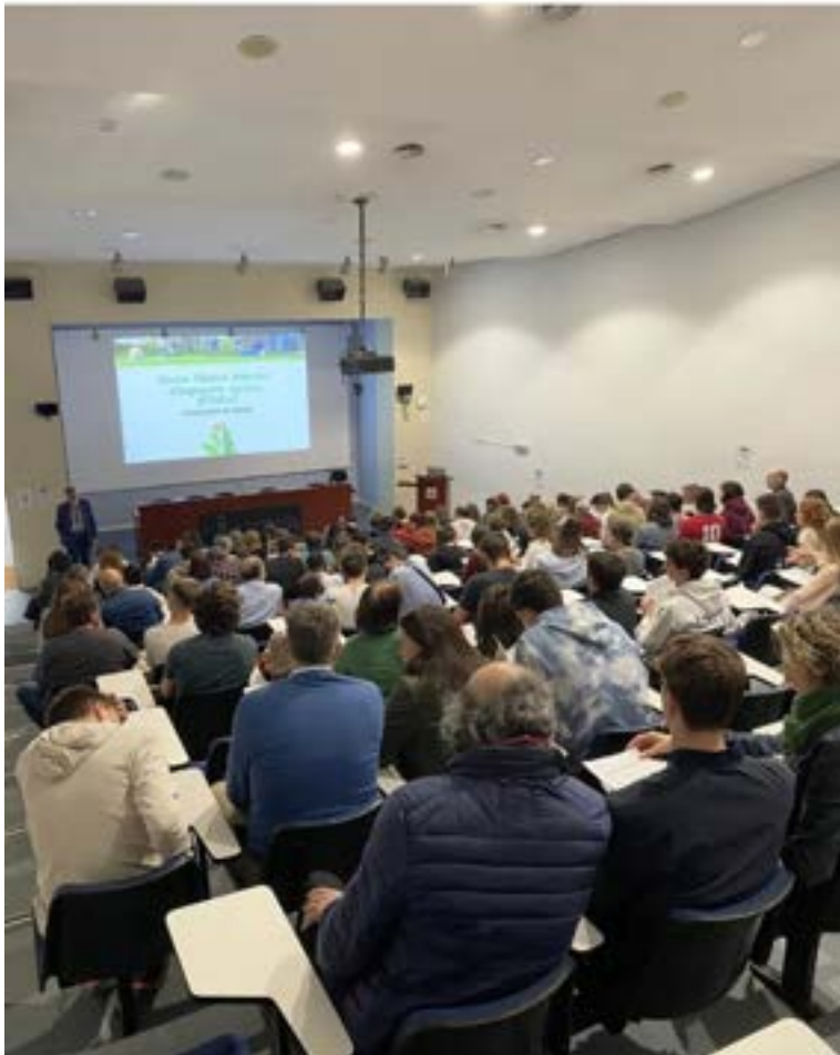
Trobada amb famílies en les portes obertes Campus ETSEA. Foto 36