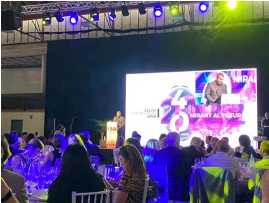
Acte Nit UEA Foto 44.