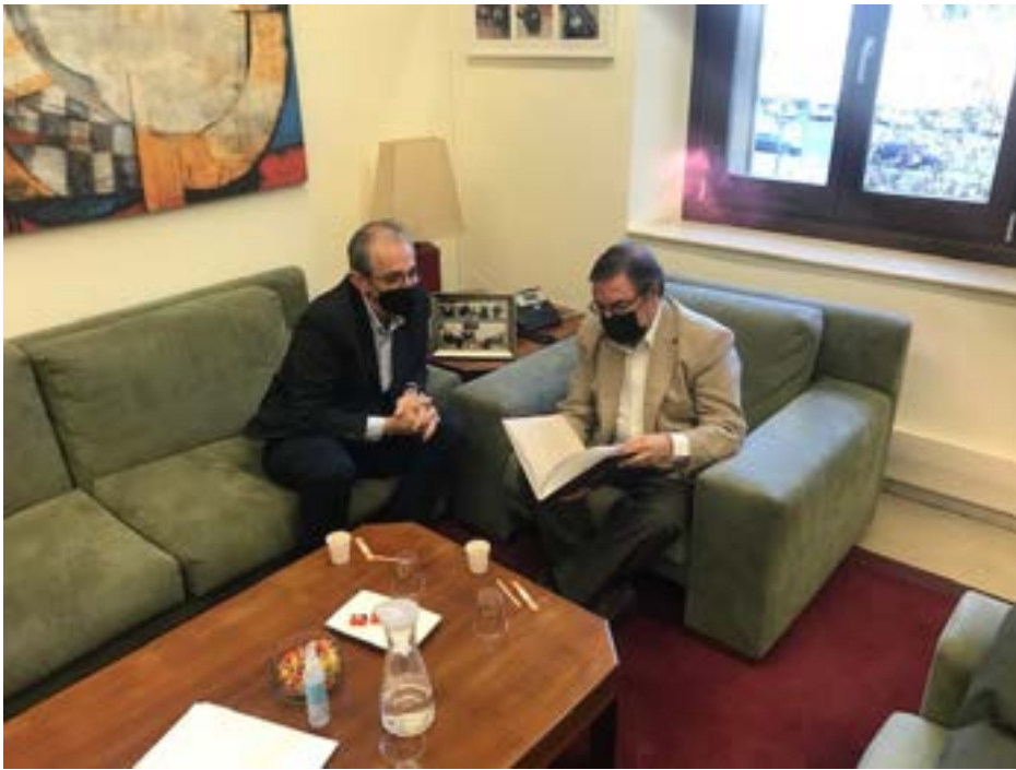
Trobada president CS i Síndic de Greuges de la UdL . Foto 19