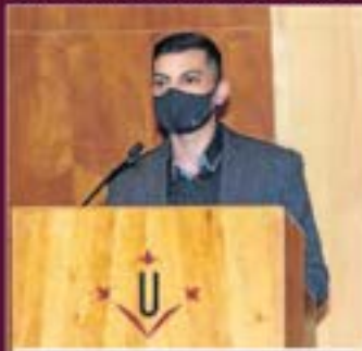
Categoria petita empresa Intech3D i Invelon