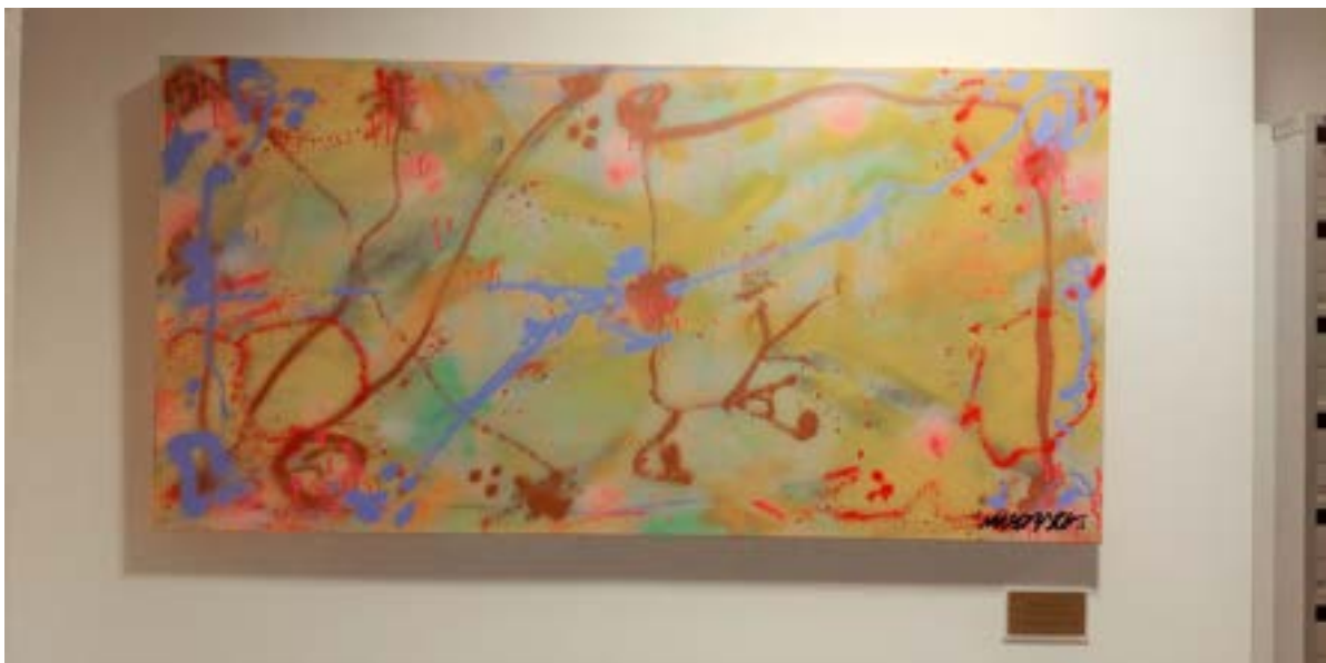
Exposició a la FDET del quadre lliurat. Foto 24