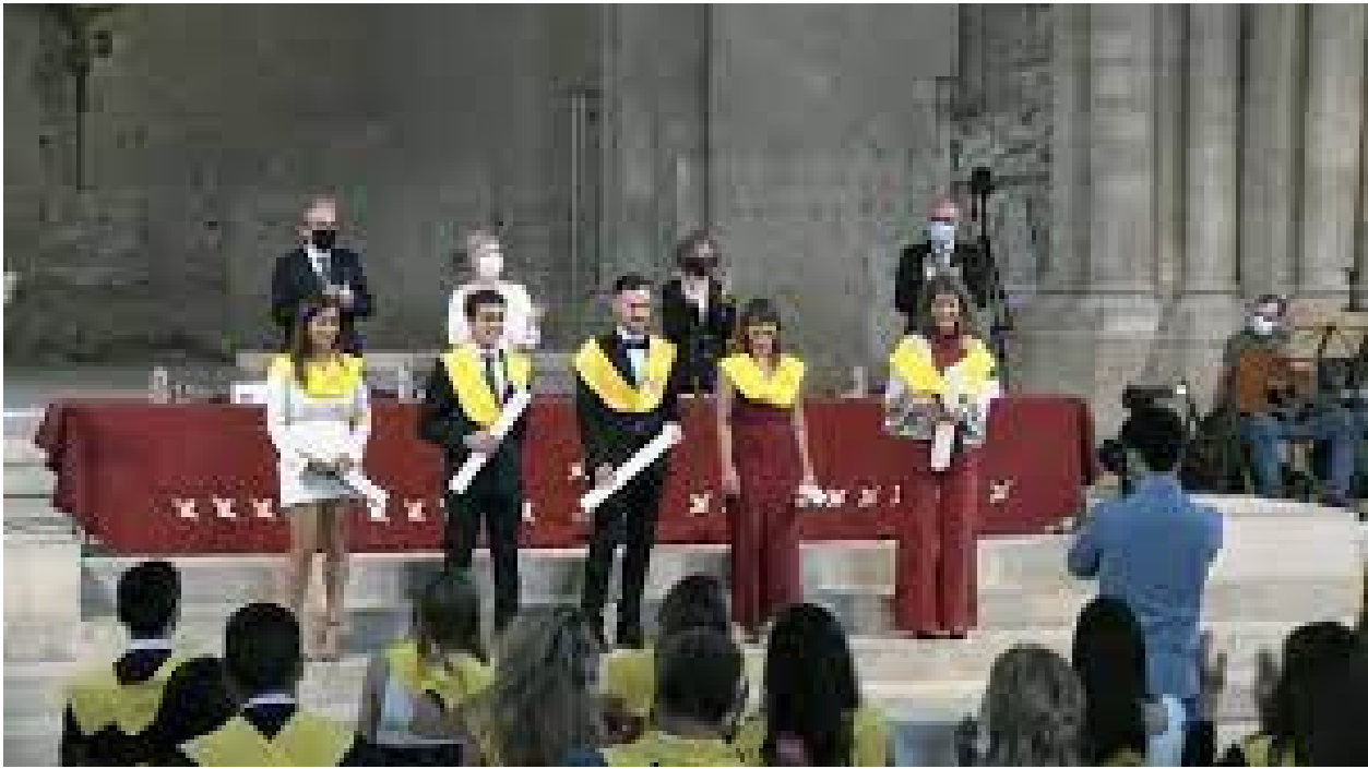
Acte lliurament Orles FEPTS. Foto 41