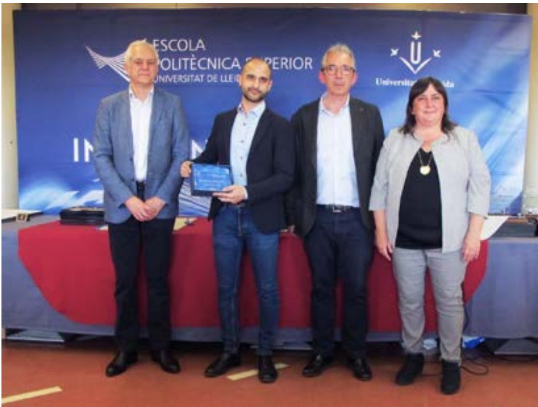
Acte lliurament premis Alumni EPS. Foto 34