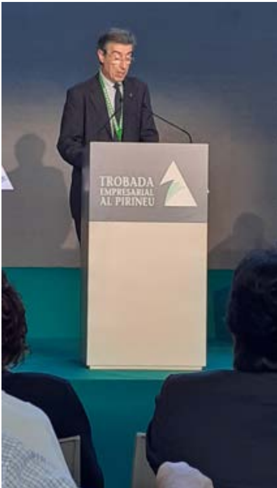
Imatges de participació de la Universitat en la Trobada empresarial al Pirineu. Fotos 42 i 43