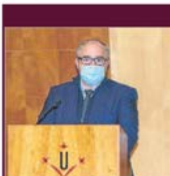
Reconeixement al lideratge social Equip UCI de l'Hospital Arnau de Vilanova