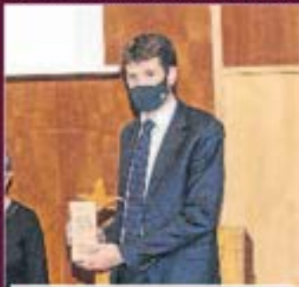
Categoria gran i mitjana empresa Indalidra, SA