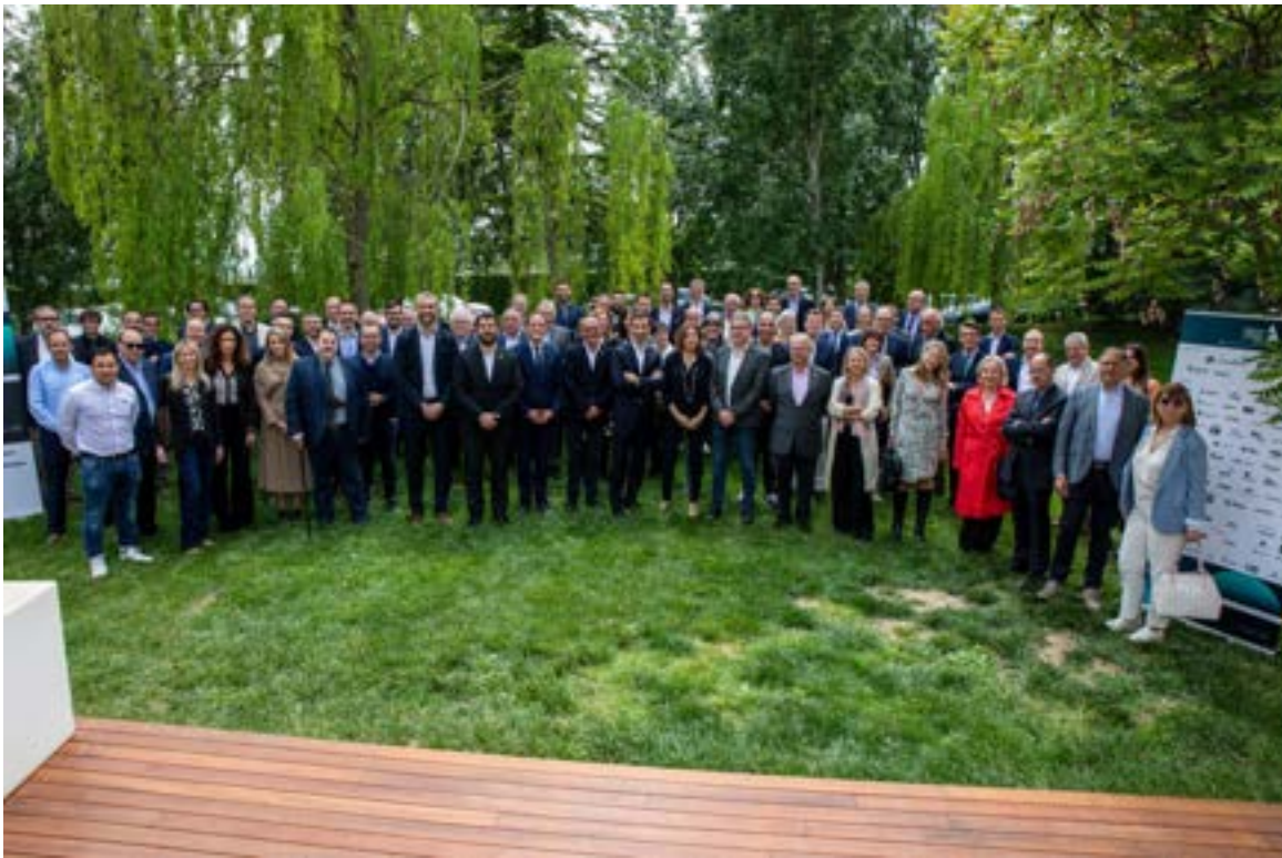
Assistents a la presentació de trobada empresarial al Pirineu 2022 Foto 33