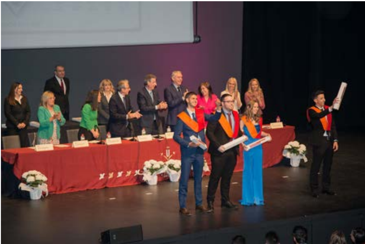
Acte de lliurament Orles FDET UdL. Foto 37