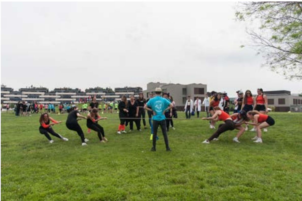
Imatge d'una activitat en motiu de la celebració de la festa Major de l'estudiantat Foto 32