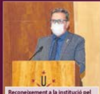
Reconeixement a la institució pel seu compromís amb la UdL Diputació de Lleida