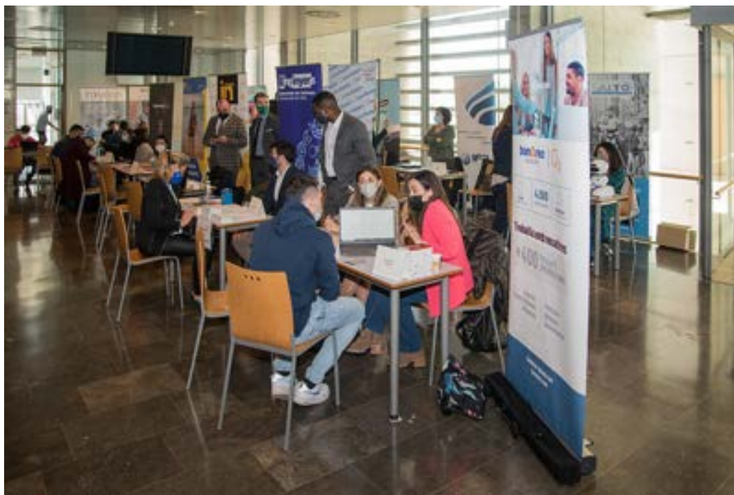
Fira UdL treball de la UdL Foto 27