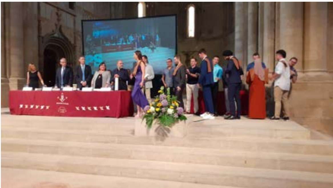
Acte lliurament Orles EPS. Foto 47