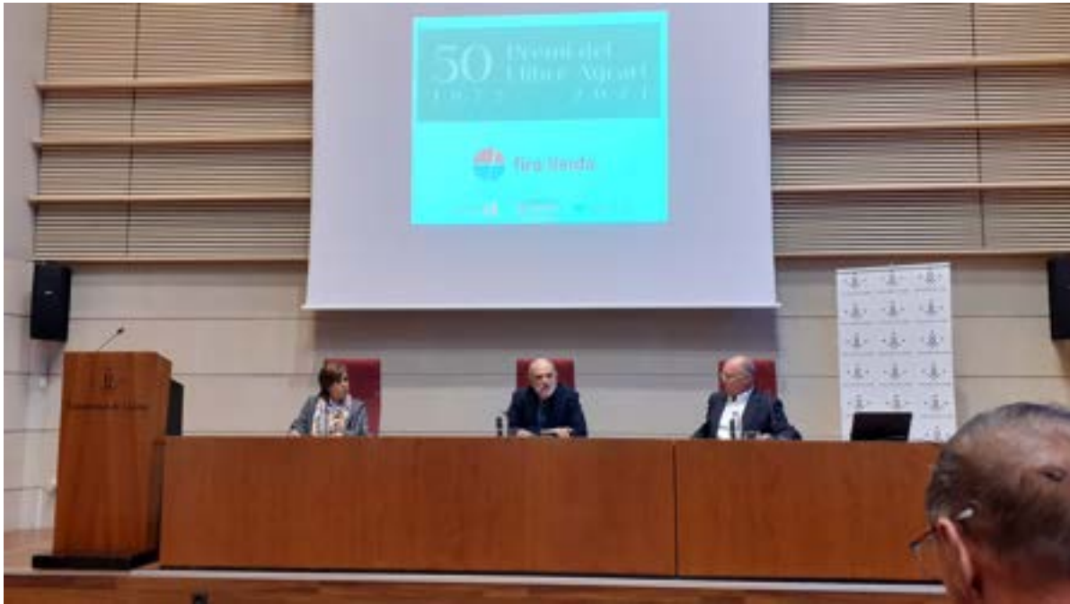
Acte de celebració 50 aniversari del Premi Llibre Agrari Foto 31