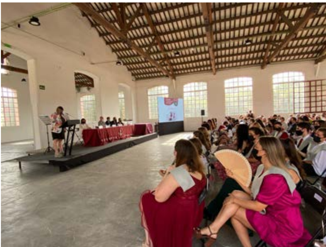
Lliurament Orles FIF UdL a Igualadala Foto 7