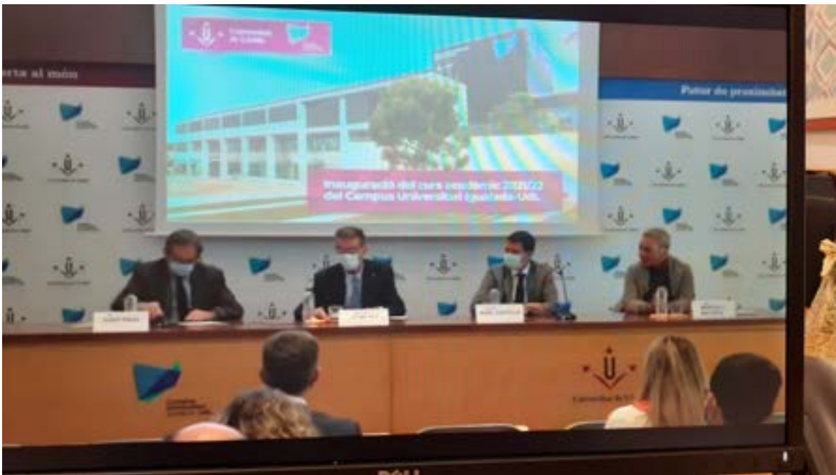
Inauguració curs acadèmic de la UdL a Igualada Foto 6