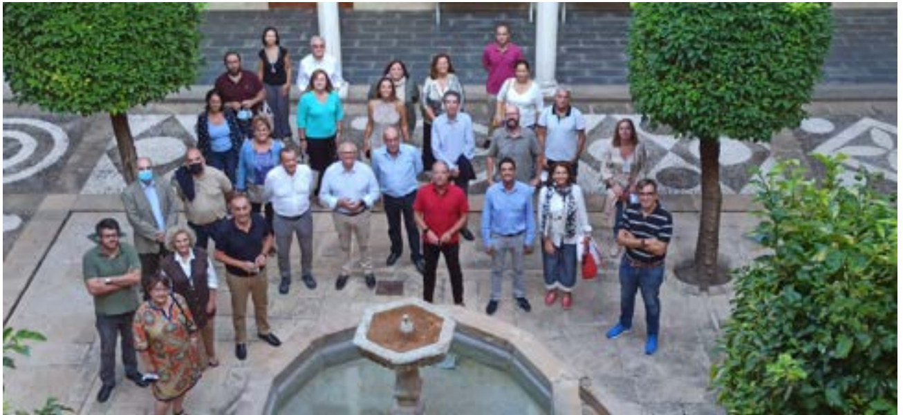
Jornades de Política i Gestió Universitaria organitzat per la Universitat Internacional d'Andalusia.. Fotos 4 i 5