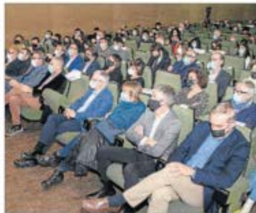
Vista del públic assistent a l'acte de lliurament dels premis.

qual es va reconèixer la seva col·laboració estreta amb FETSEA des dels inicis de l'Escola d'Agroensim, tant des de l'àmbit de producció i collita, l'àmbit de tecnologies d'aliments, així com la col·laboració en els últims anys amb l'Institut de Recerca Biomèdica. Les empreses Invelon i Intech3D, com a petita empresa, fundades per un grup d'estudiants de la UdL, amb altres joves emprenedors, són un referent en l'àmbit de la digitalització i les noves tecnologies i col·laboren estretament amb la UdL, principalment amb TEPS. Respecte a la institució premiada, ha estat la Diputació de Lleida en reconeixement de la implicació i compromís fins i tot des d'abans de la creació de la UdL, donant suport econòmic i amb la creació d'infraestructures i terrenys, en centres i àrees de coneixement, dotant d'infraestructures com el Campus ETSEA, finançant diversos Càtedres UdL. En la nova categoria de reconeixement 2021 al lideratge social, el jurat no va tenir cap mena de dubte a atorgar aquest premi a la Unitat de Cures Intensiva de l'Hospital Universitari Arnau de Vilanova per la seva gestió i comatge davant tota la situació de la Covid. A l'acte va assistir un grup representatiu de l'equip UCL.