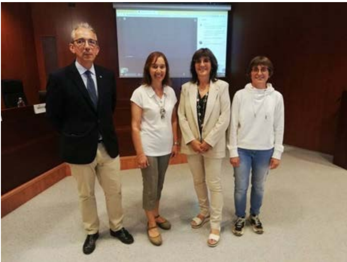
Acte de presentació de l'estudi " Valor Social de la UdL". Foto 40