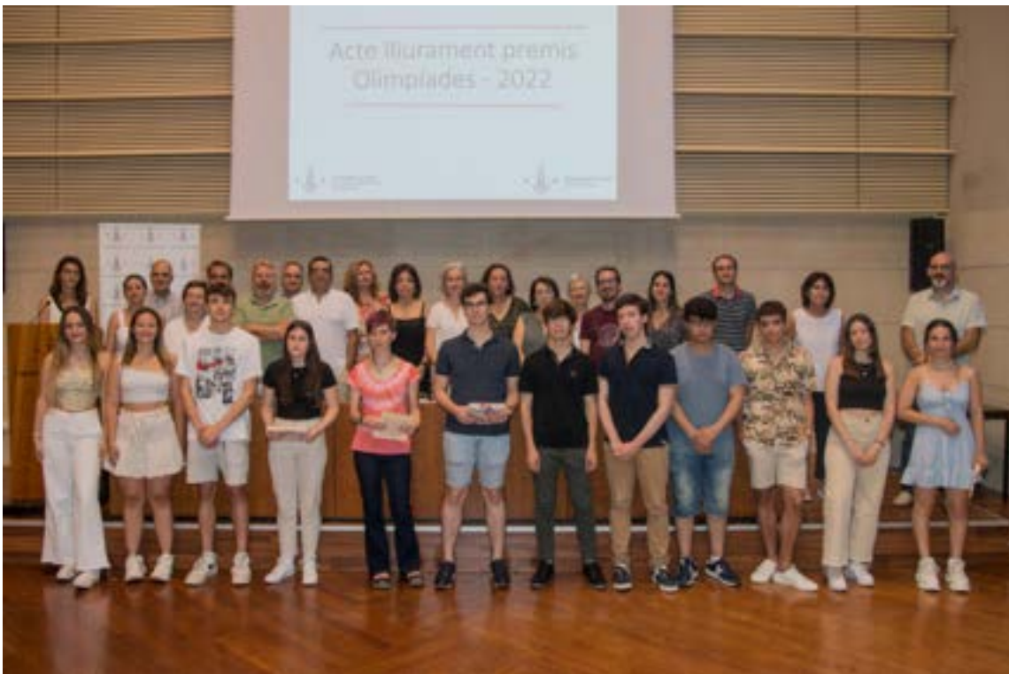
Acte lliurament premis Olimpíades. Foto 45