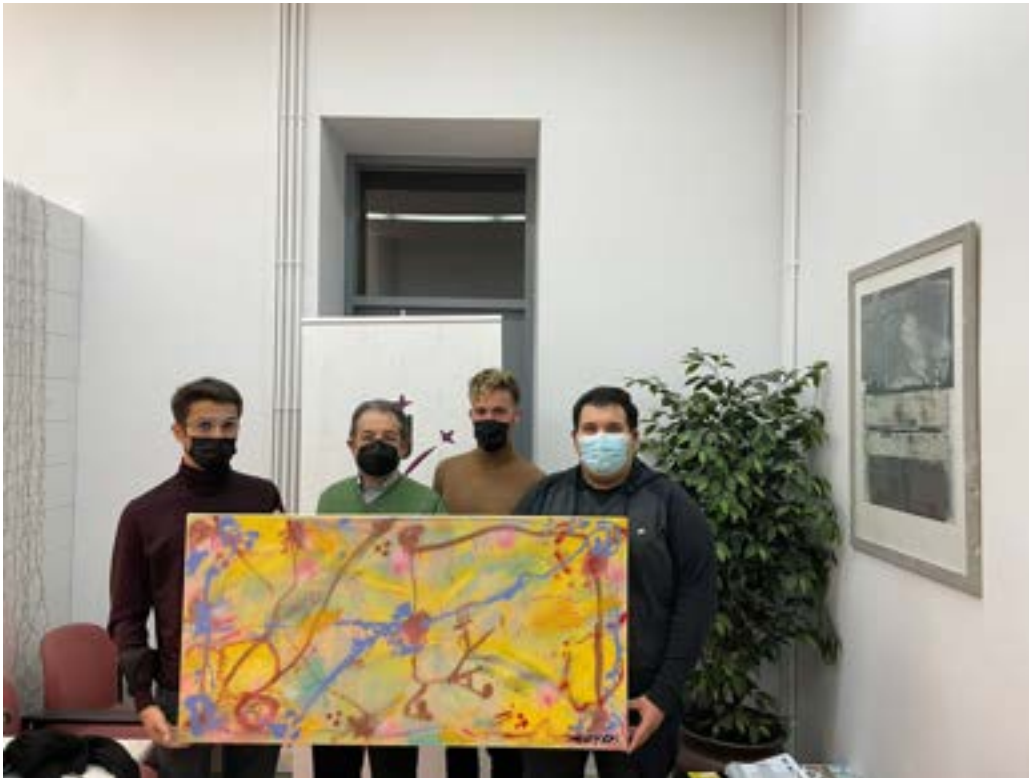
Lliurament quadre d'AKA Modesto del Consell de l'estudiantat UdL al Consell Social Foto 22