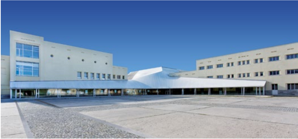
Vista del Magical del PCiTal Foto 21