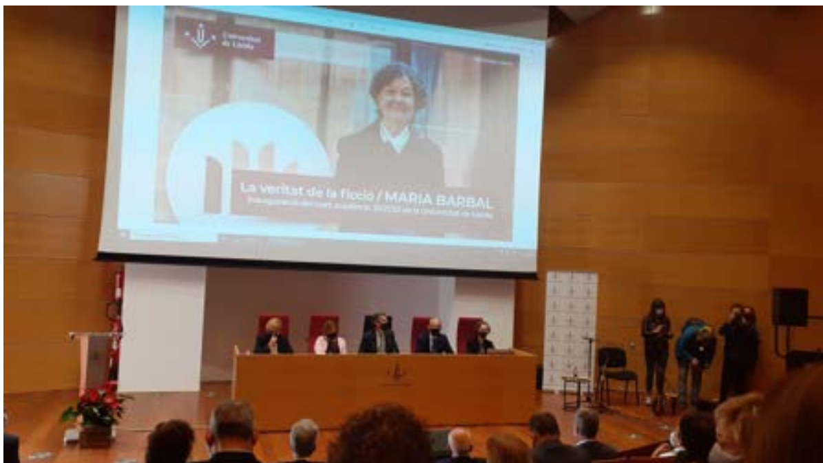
Inauguració curs acadèmic de la UdL Foto 3