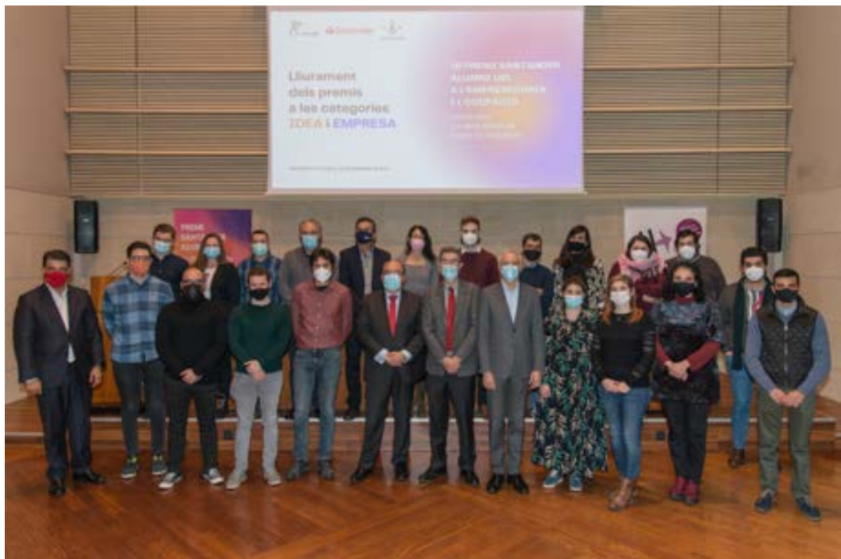
Acte lliurament Premis Alumni emprendeoria Foto 18.