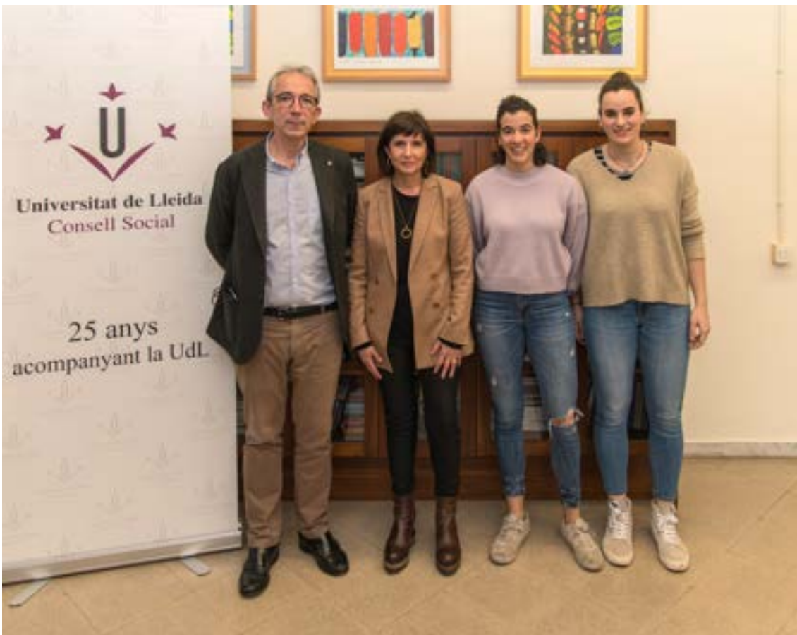
Degana de la FIF, president CS i estudiants de Màster amb TFM a Gàmbia . Foto 20