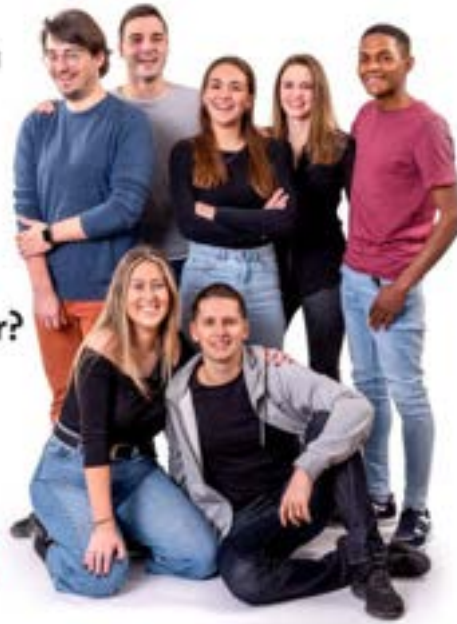
Cartell de promoció de les Portes Obertes UdL Foto 35