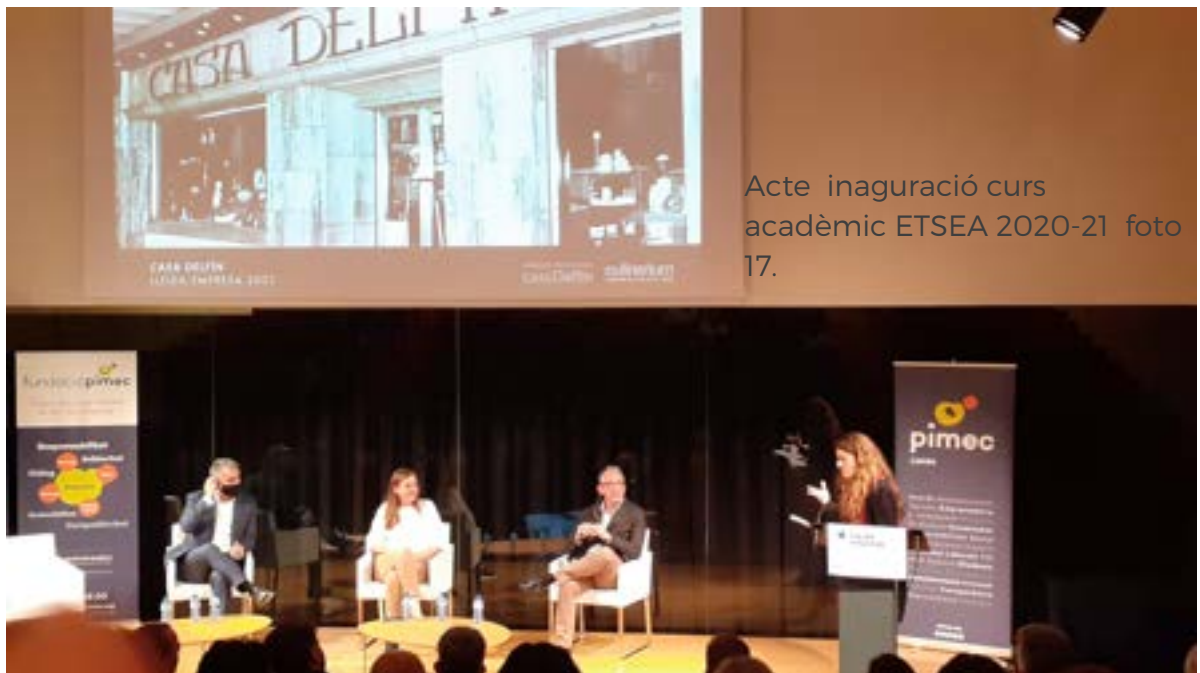
Acte inaguració curs acadèmic ETSEA 2020-21 foto 17.