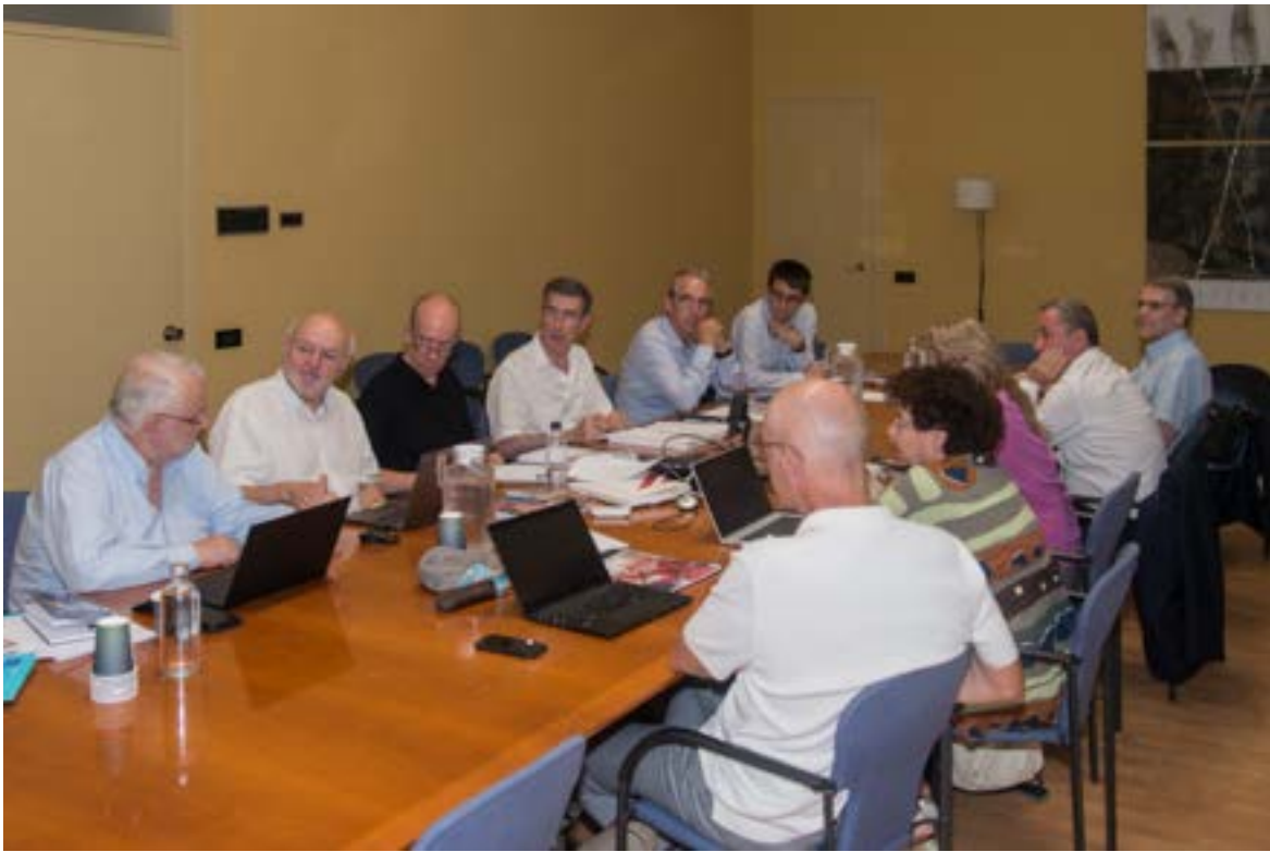
Reunió ACUP a la UdL. Foto 46