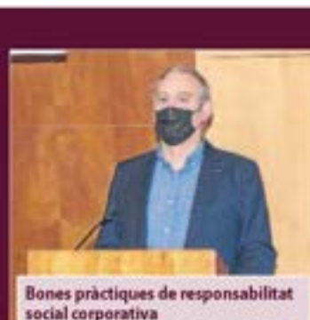
Bones pràctiques de responsabilitat social corporativa

Facultat de Dret, Economia i Turisme (FDET) i Unitat de Desenvolupament i Cooperació (UDC)