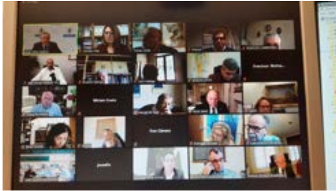
Assamblea Conferencia de Consejos Sociales. Foto 1