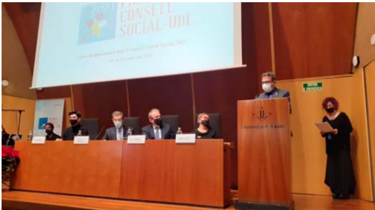
Acte lliurament de Premis Consell Social Foto 15.