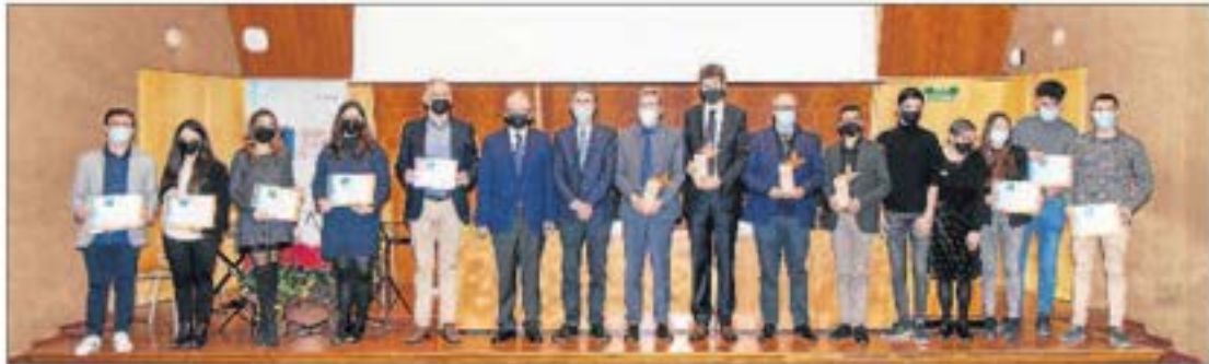
Tots els guardonats i els membres de la taula de lliurament dels premis.