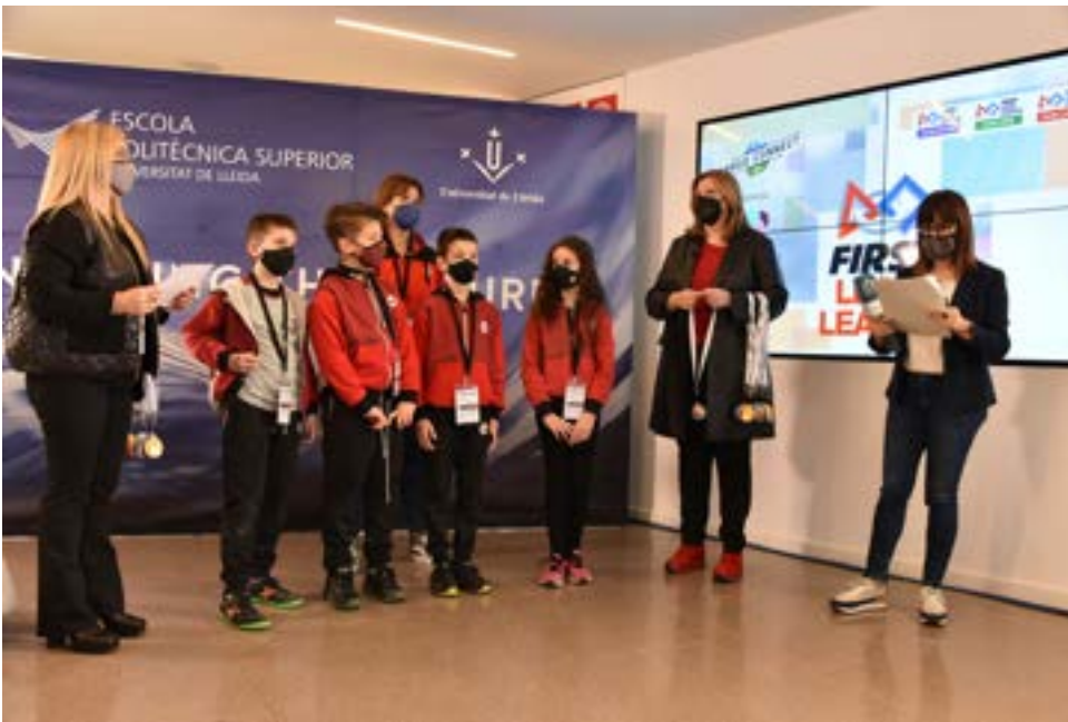
First Lego League, moment lliurament medalles UdL Foto 25