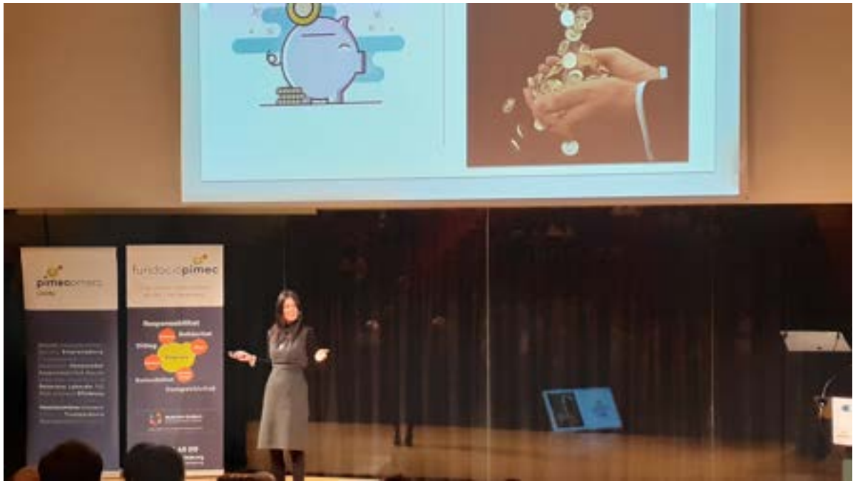
Jornada Lleida empresa organitzat per PIMEC Lleida Fotos 12 i 13